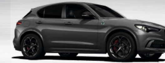
035 Grigio Vesuvio