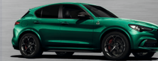
646 Verde Montreal