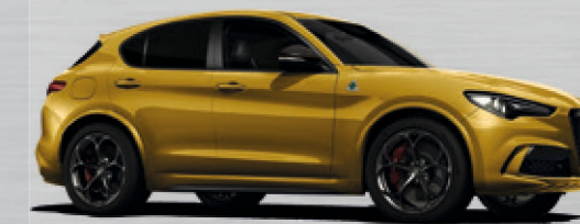
437 Ocra Lipari