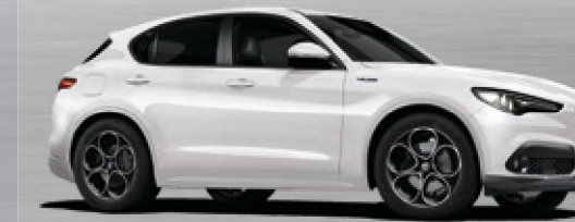
217 Bianco Alfa