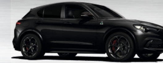
408 Nero Vulcano