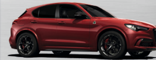
414 Rosso Alfa