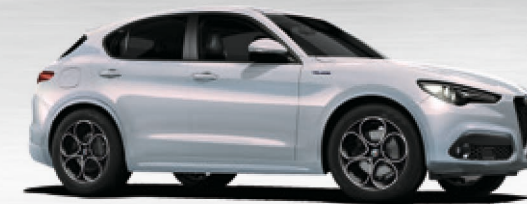
252 Perla Lunare