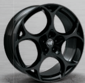
TURISMO, dunkel lackiert