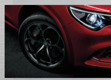
CLASSICO, dunkel lackiert