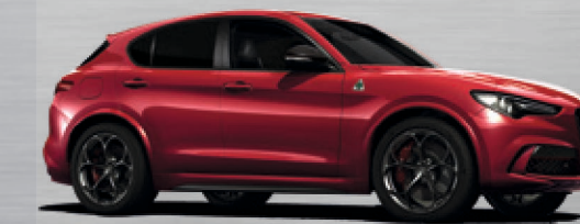
438 Rosso Etna