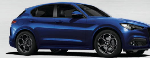
486 Blu Anodizzato