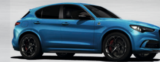
756 Blu Misano